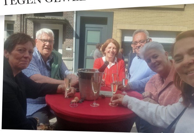
JAARMARKT ST JOZEF