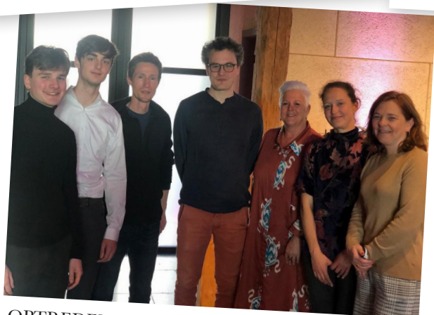
OPTREDEN ACADEMIE BIJ HOF VAN BOERES