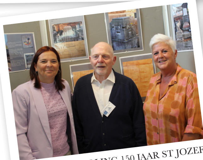
TENTOONSTELLING 150 JAAR ST JOZEF