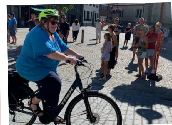
FIETS MET AUTOWIJDING