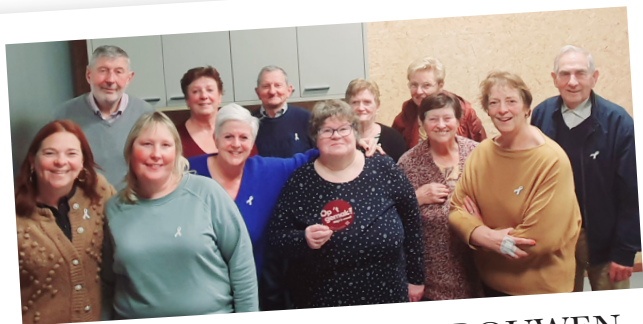
TEGEN GEWELD OP VROUWEN