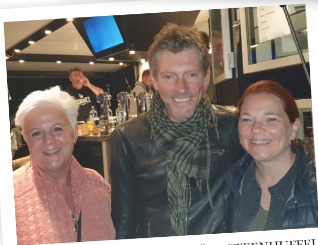
VLAMMETJES VOOR OEKRAÏNE STEENHUFFEL